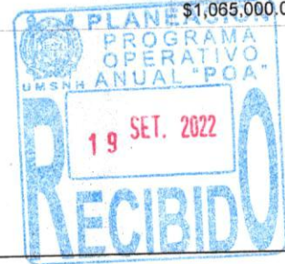
Director de la Comisión de Planeación Universitaria